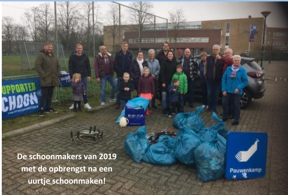
De schoonmakers van 2019 met de opbrengst na een uurtje schoonmaken!

We starten om 10.00 uur bij het parkeerterrein van het Niftarlake College met koffie, limonade en een koek. Wij hopen - net als vorig jaar - op een grote opkomst. Voor knijpers, zakken c.a. wordt gezorgd.